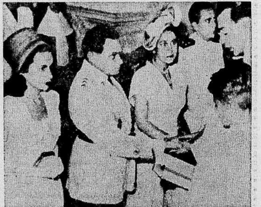
O Coronel Castelo Branco comemora suas bodas de prata

Naquele episódio ele começou a despontar entre os pedes da luta velada que imporia novos rumos à política nacional a partir de abril de 1964.